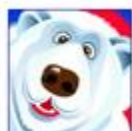
“Wild” simbola noteikumi